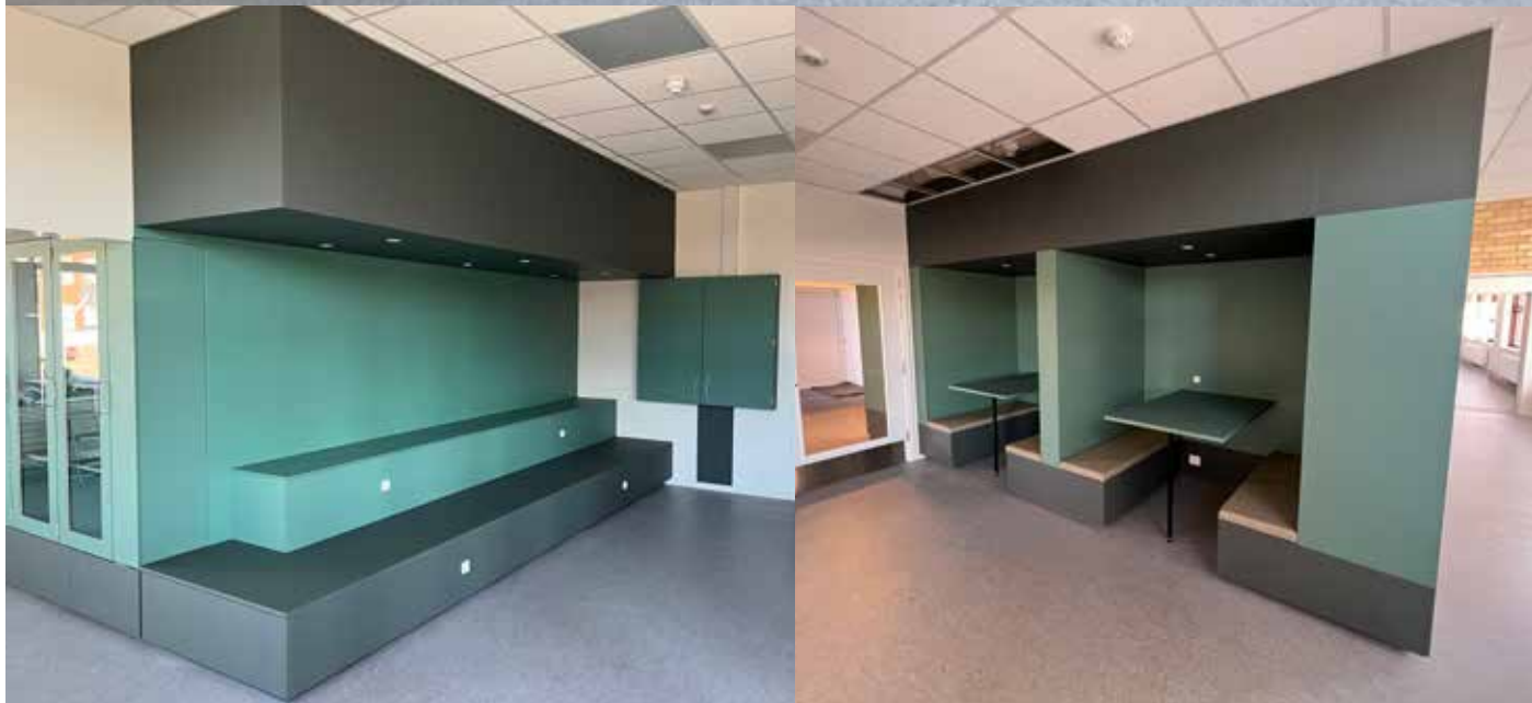
Gruppemiljøer og bord, læringstrapper, lesehuler og oppbevaring, Lindehøjskolen, 2023