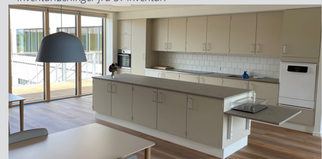
Fripleiehemmet Magdalene Mariehemmet i Sorø 2023 – ST Skoleinventar har levert inventar og dokumentasjon til prosjektet, som var et DGNB Gull-prosjekt.